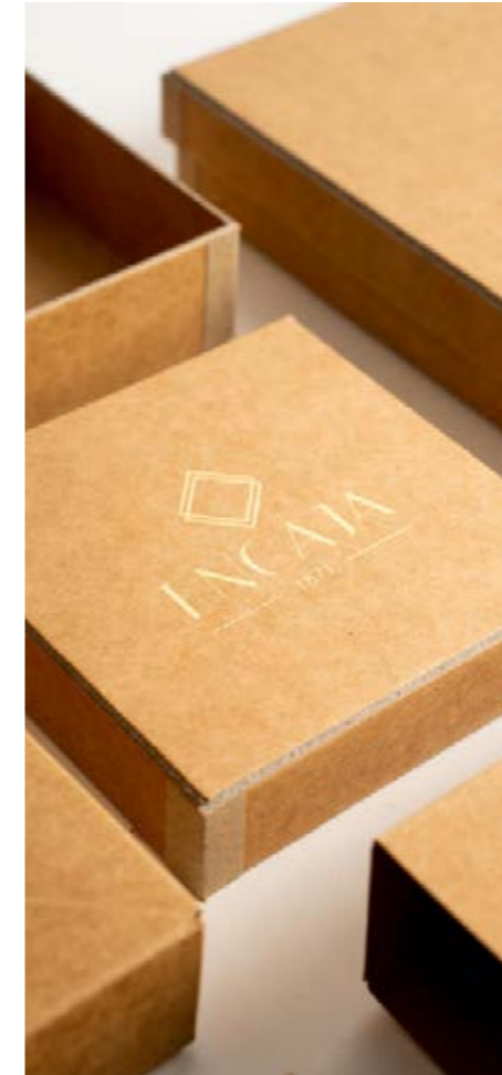
01 ECO LINE