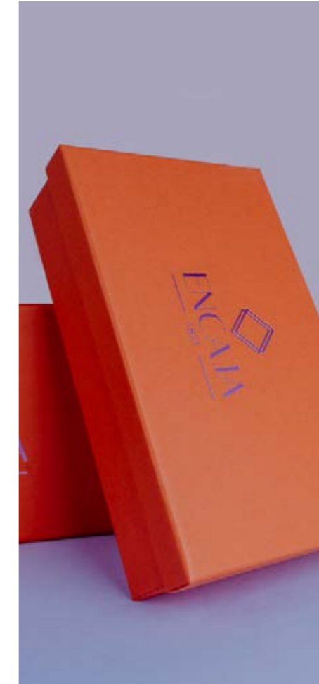
02 BOÎTES RIGIDES