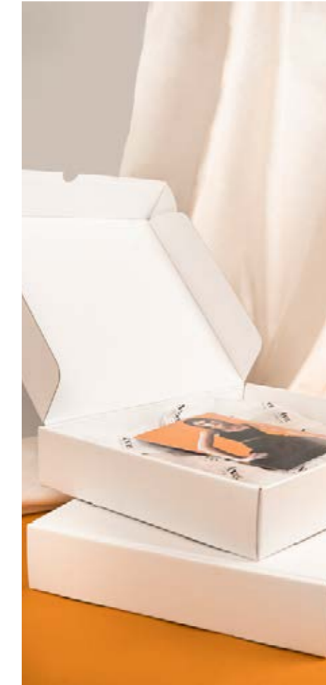
03 À MONTER SOI-MÊME